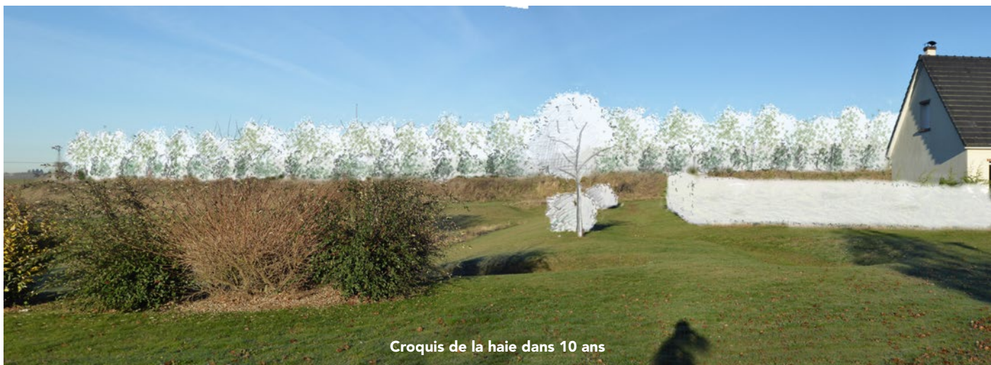
Croquis de la haie dans 10 ans